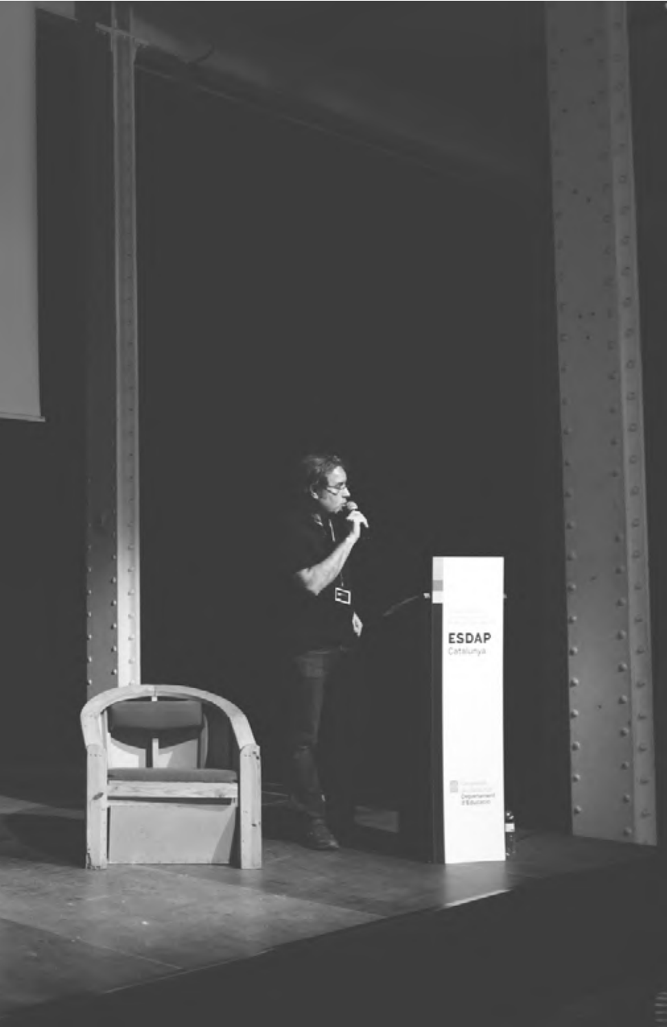
Presentació catàleg BDW18: Dissensió, ètica i procés col·lectiu