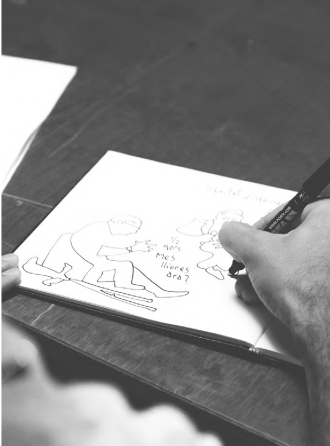
Il·lustració Pedro Strukej]