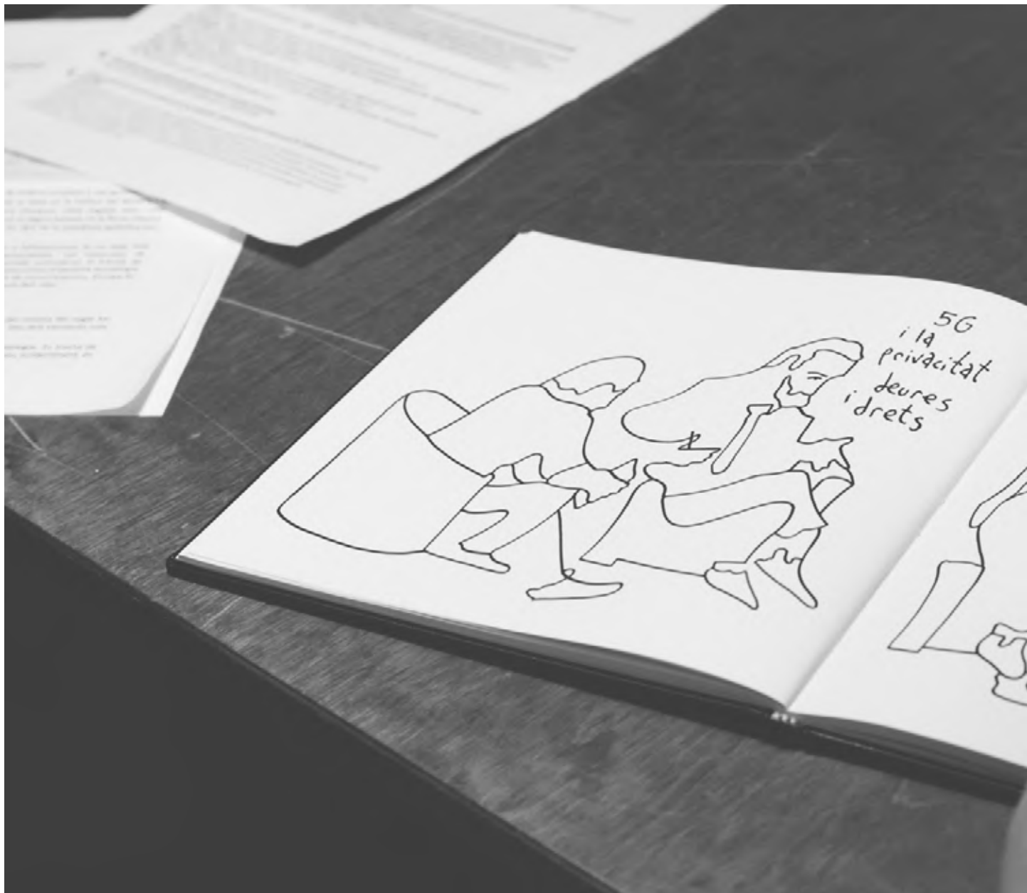
Il·lustració Pedro Strukej